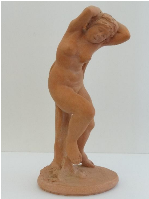
Danseuse - MG 25 - Terre cuite – 1951 – 33x16x18 cm Georges-Clément de Swiecinski

(le musée est fermé au public du lundi 1 er septembre au vendredi 12 septembre)