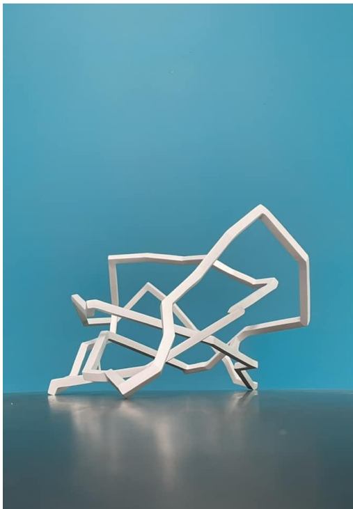
Sans titre – Acier – 2024

Tout l'art de Nicolas Sanhes est de capter l'espace entre ses lignes et faire du vide, une présence.