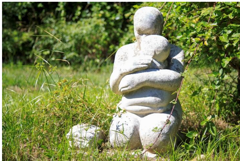
La maternité - Taille directe – 1950 - H. 80 cm – Killy Beall

Un moment d'exception pour découvrir l'ensemble de l'œuvre de Swiecinski et célébrer Killy Beall et le musée de Guéthary.